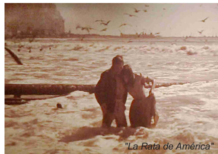
"La Rata de América"