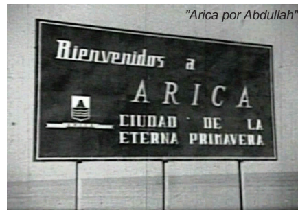
"Arica por Abdullah"