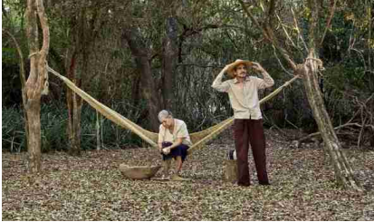
Hamaca Paraguaya Paz Encina. Paraguay. 35mm. 76'. 2006.

Ramón y Cándida una pareja de ancianos esperan a su hijo que ha partido a la guerra del Chaco, mientras esperan también a la lluvia que tampoco llega.